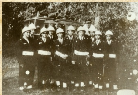
Lata 70- te