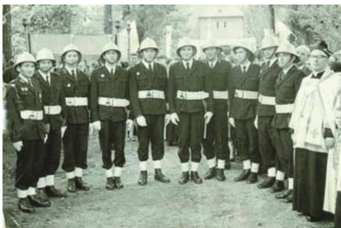
Zatrzymać czas- OSP Rojewo str. 11-12