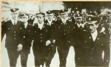
Jubileusz 75 lecia w Gniewkowie 1963r

W tym samym roku na wyposażenie wszedł samochód pożarniczy LUBLIN 51, który zastąpił OPLA, tego samego, który przebył drogę do Berlina i z powrotem, pojazd ten początkowo skrzyniowy z plandeką został skarosowany w Hrubieszowie i przystosowany na pożarniczy, nie miał niestety własnego zbiornika wodnego przez co strażacy musieli budować długie linie gaśnicze, by podać wodę z najbliższego stawu lub jeziora. Niskie ciśnienie w rojewskich hydrantach było przeszkodą w użyciu ich w akcjach gaśniczych. Jednostka otrzymała również dwie nowe motopompy M8/8 i M4/4.