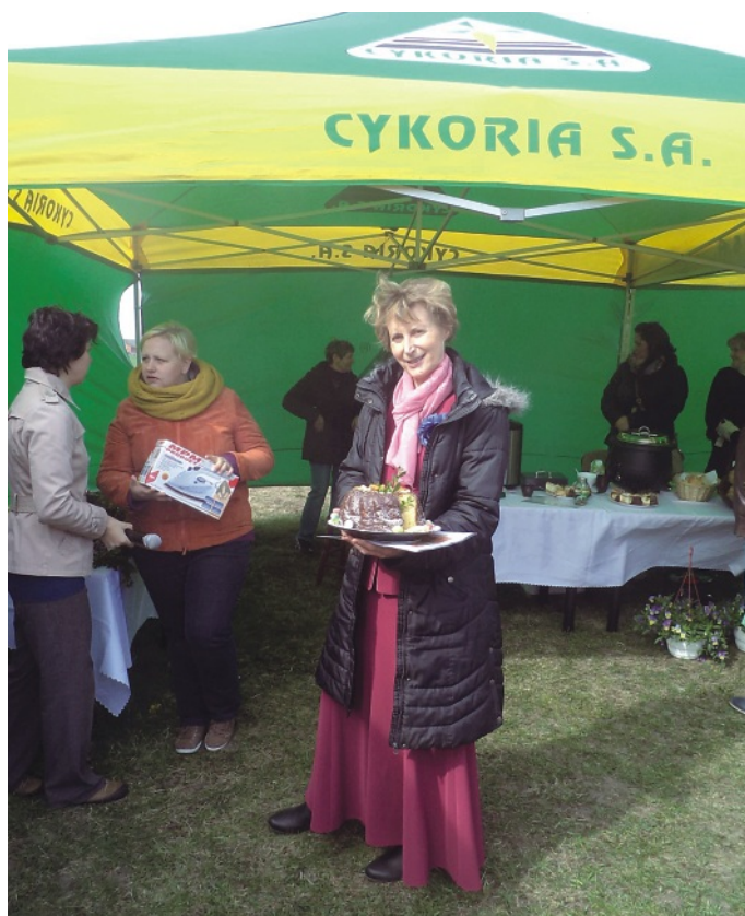
Kiermasz w Miogoniewicach str.2