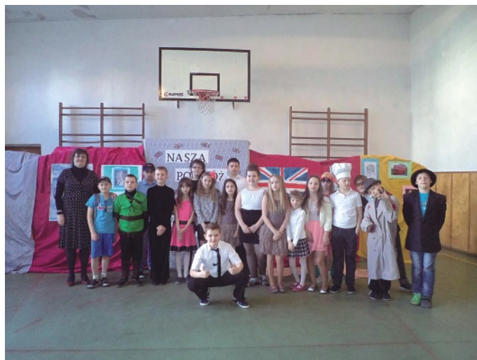
Oświata znaczy dziecko str. 5-6 + zdjęcie nr 1